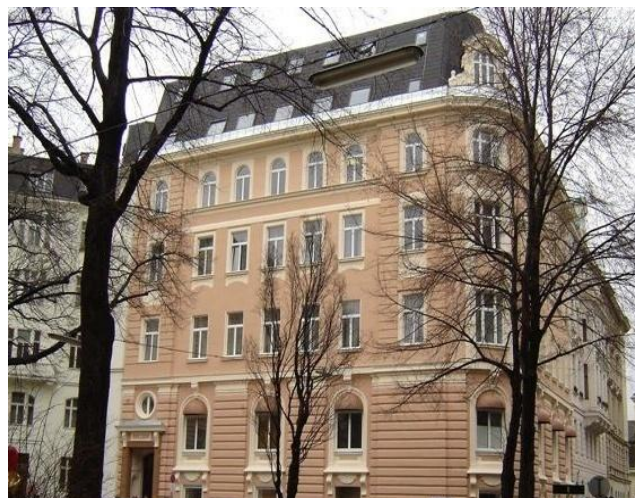
Особняку на Брамсплатц – 100 лет

После войны в этом здании работали различные советские учреждения: отделения ТАСС, АПН, Интуриста, представительства