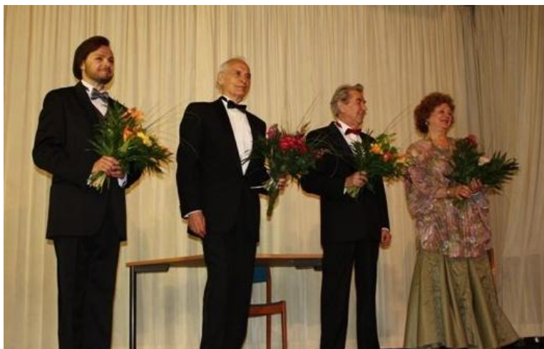
Концерт в Вене

В конце 80-х годов коммунистическая партия Австрии и австрийско-советское общество дружбы стали переживать финансово-материальные трудности, что сказалось и на работе организаций, размещавшихся в Доме, а в 1991 году общество заявило о самороспуске. Была ликвидирована библиотека, закрыты языковые курсы.