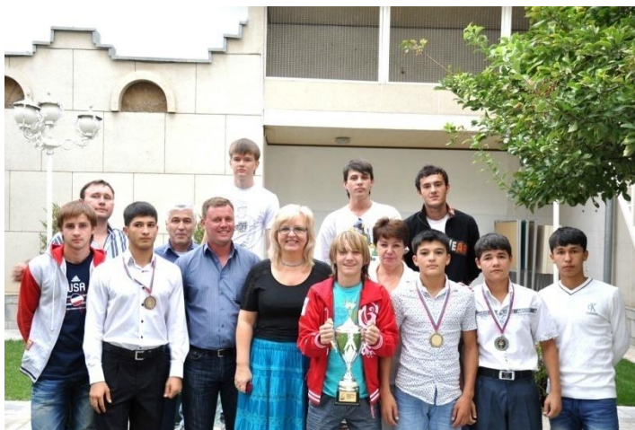
Встреча с узбекскими участниками Фестиваля

15 сентября 2010 г. в Ташкенте в Российском центре науки и культуры прошла встреча со спортсменами Узбекистана – участниками III спортивного юношеского фестиваля. Организаторами фестиваля выступили Международный совет российских соотечественников (МСРС) и Правительство Москвы, при поддержке Правительственной комиссии по делам соотечественников за рубежом, Министерства иностранных дел Российской Федерации и Россотрудничества. Поездка была организована Республиканским русским культурным центром при содействии представительства Россотрудничества.