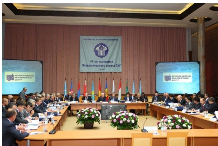
Заседание Экономического Совета СНГ – новый шаг к инновационному сотрудничеству