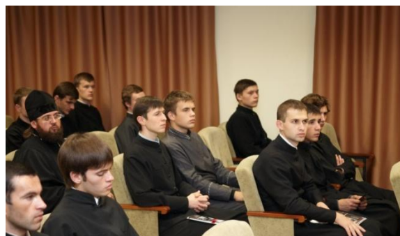
Слушатели духовной Академии на Телекинофоруме

Особенность Телекинофорума в том, что в 2010 году Россотрудничество впервые выступало в роли его генерального партнёра.